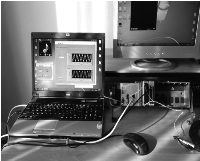
Slika 2: Daljinski eksperiment za adaptivno filtriranje [5]